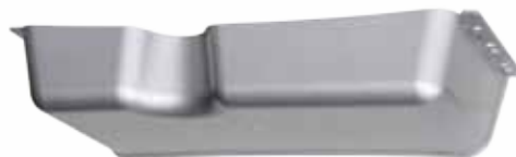
Copertura raccordi cod.: COPRAC900P

Una tecnologia nel rigoroso rispetto della base scientifica che utilizza materiali nobili e idonei a svolgere appropriate quanto differenti funzioni.